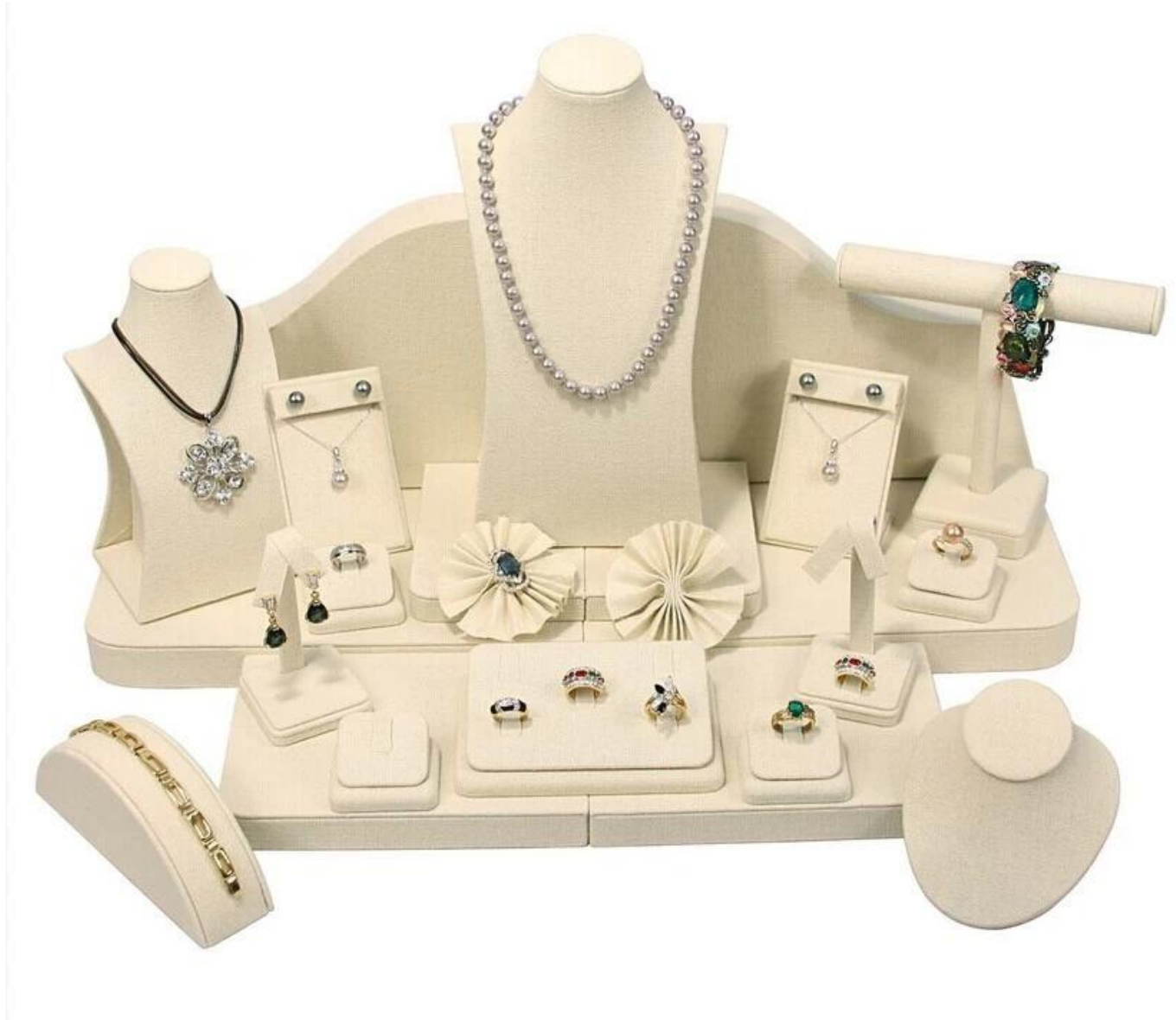
Bild von Neweat Design aus weißem Leinen Schmuck-Display Requisiten, Schmuck-Display-Halterung, Schmuck-Display-Set für Schmuck Ladentheke Schaufenster