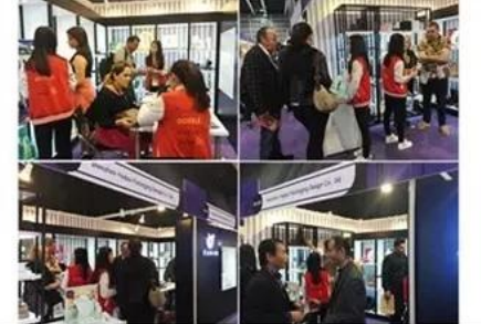
2018 Hongkong international jewellery show