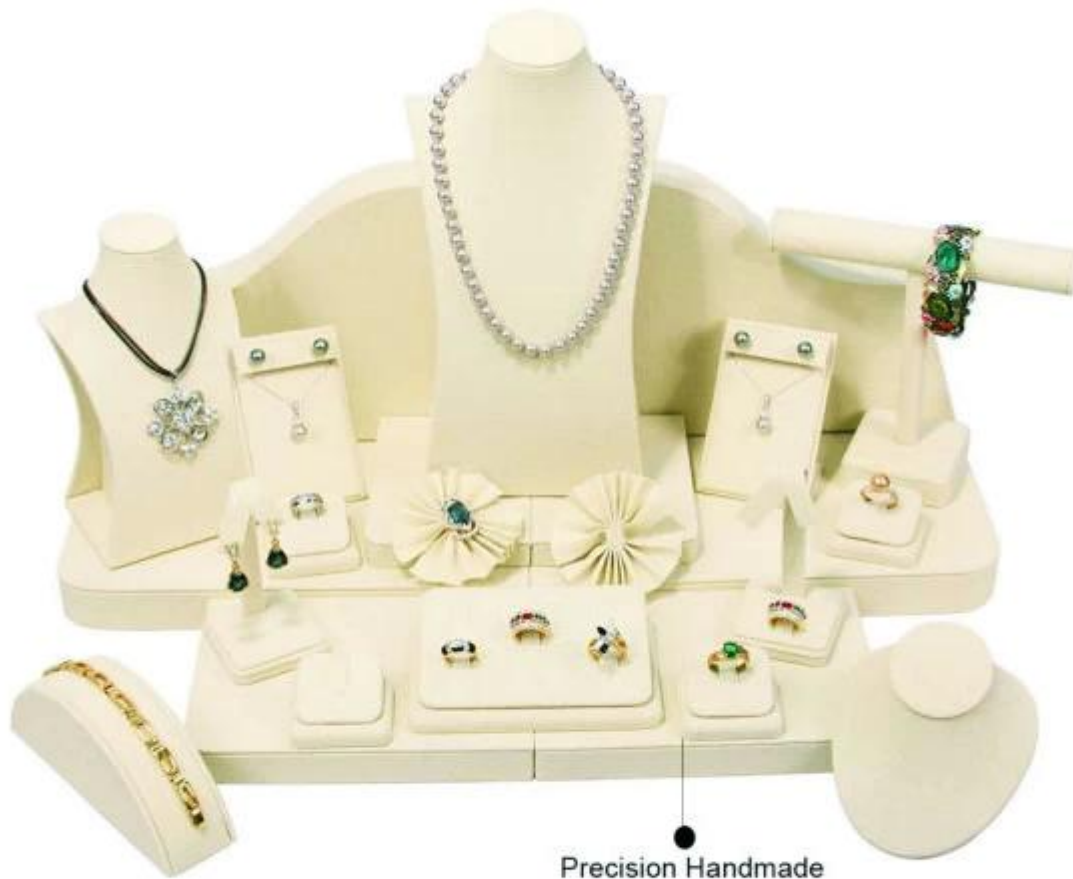
Precision Handmade Wrapped with Leather

Andere Produkte können Sie interessiert: