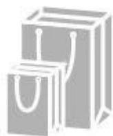
Jewelry paper bag