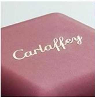
metal logo sticker