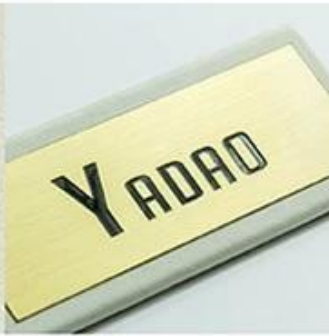
metal logo plate