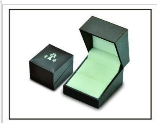
Zásobníky na šperky Šperkovnice