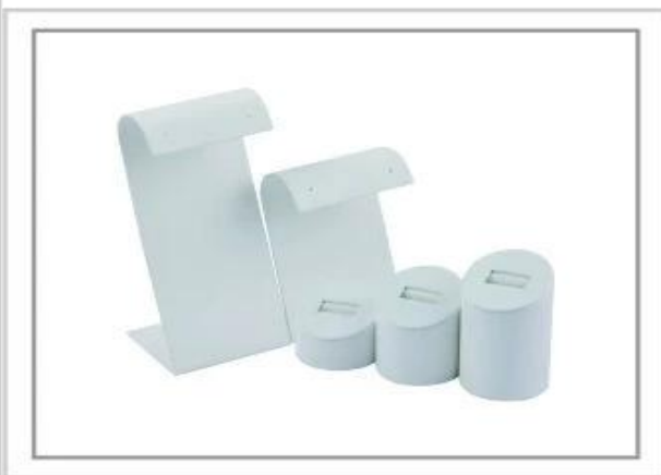
Pouzdro na šperky Stojany na šperky