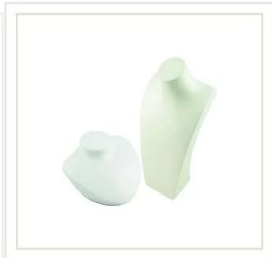
Displej na šperky stojánek na náhrdelník