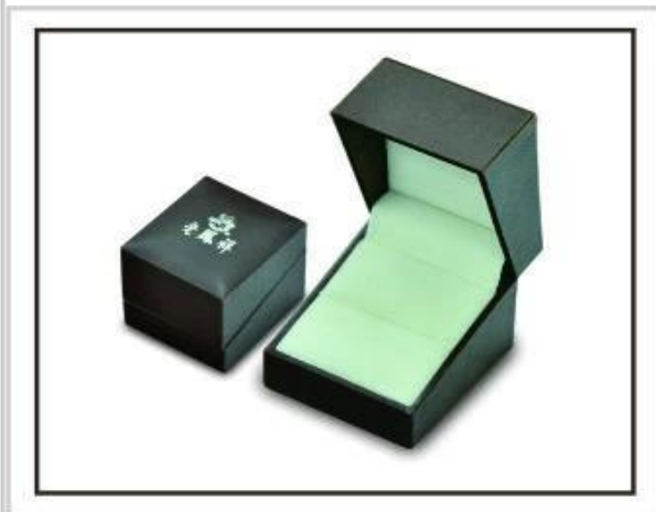
Zásobníky na šperky Šperkovnice