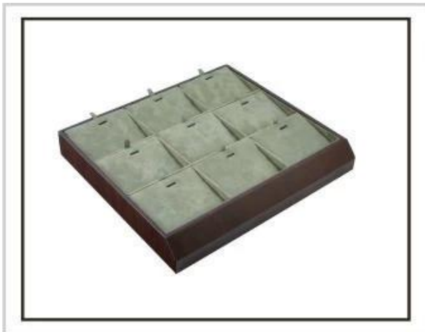
Zásobníky na šperky