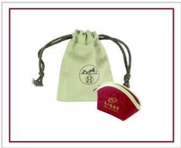
Pouzdro na šperky