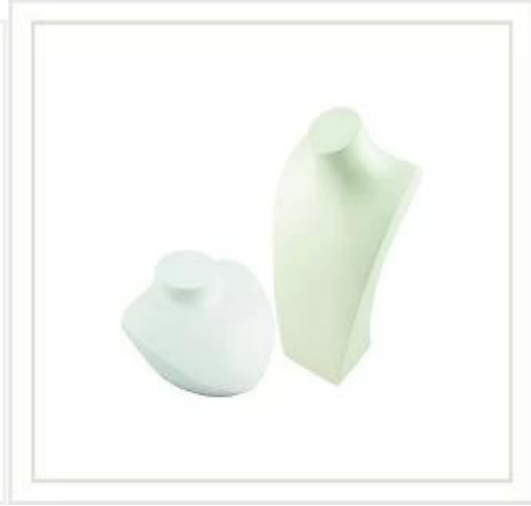
عرض المجوهرات حامل قلادة