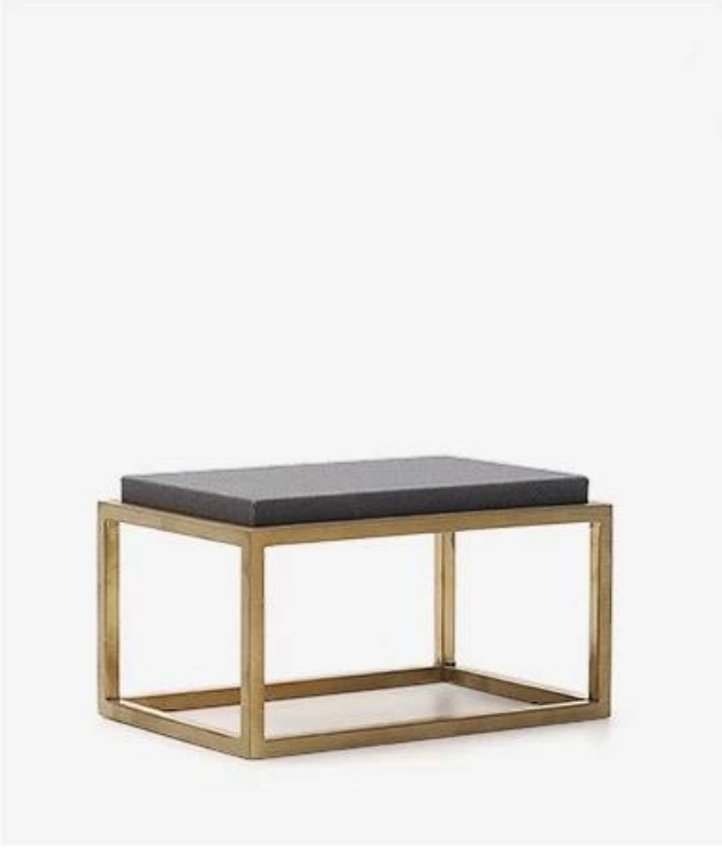
12*8*7cm (L*W*H) 295g