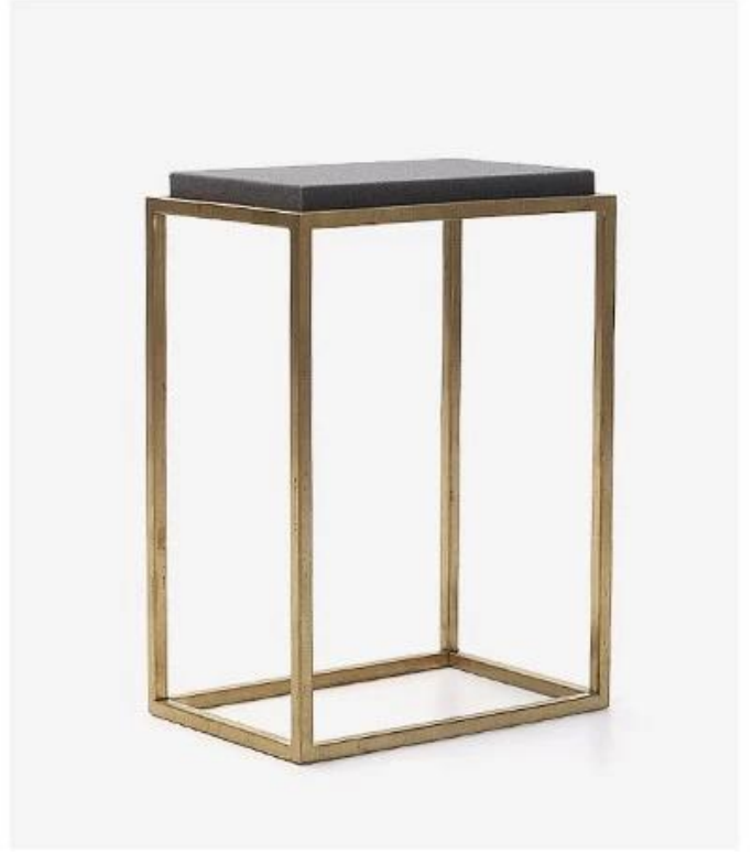
12*8*17cm (L*W*H) 375g

ايضا، آمنة التعبئة ليضمن ال في احسن الاحوال وصول