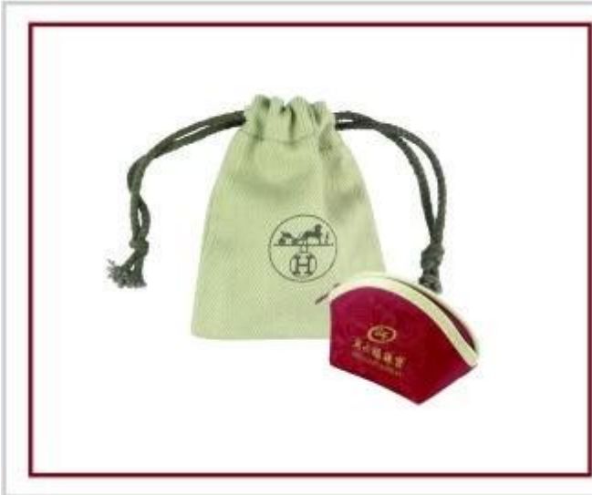
المجوهرات الاعلانية والتظاهر