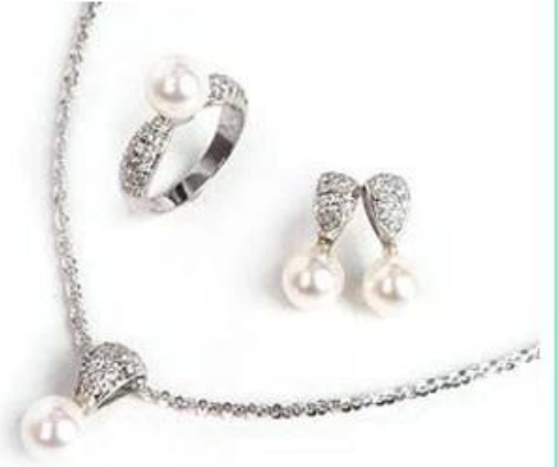
jewelry set box size: 195*190*50 mm