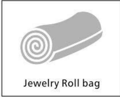
Jewelry Roll bag