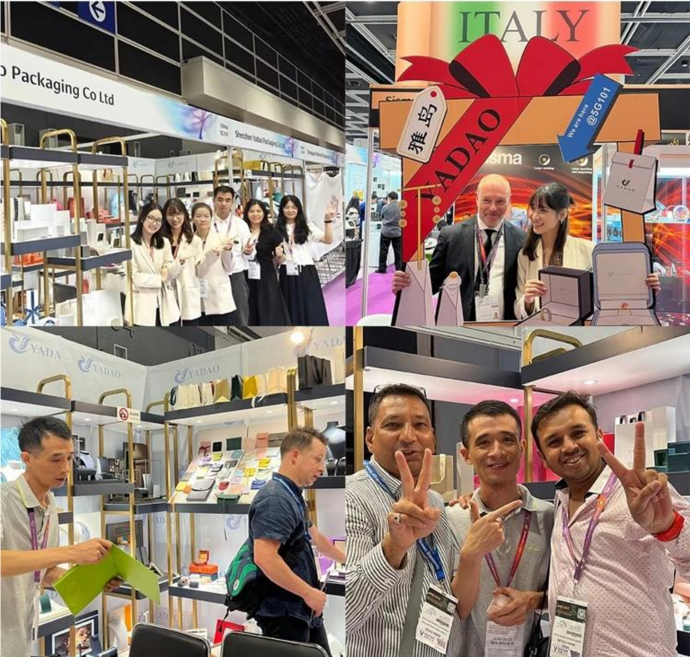
Embalagem e entrega