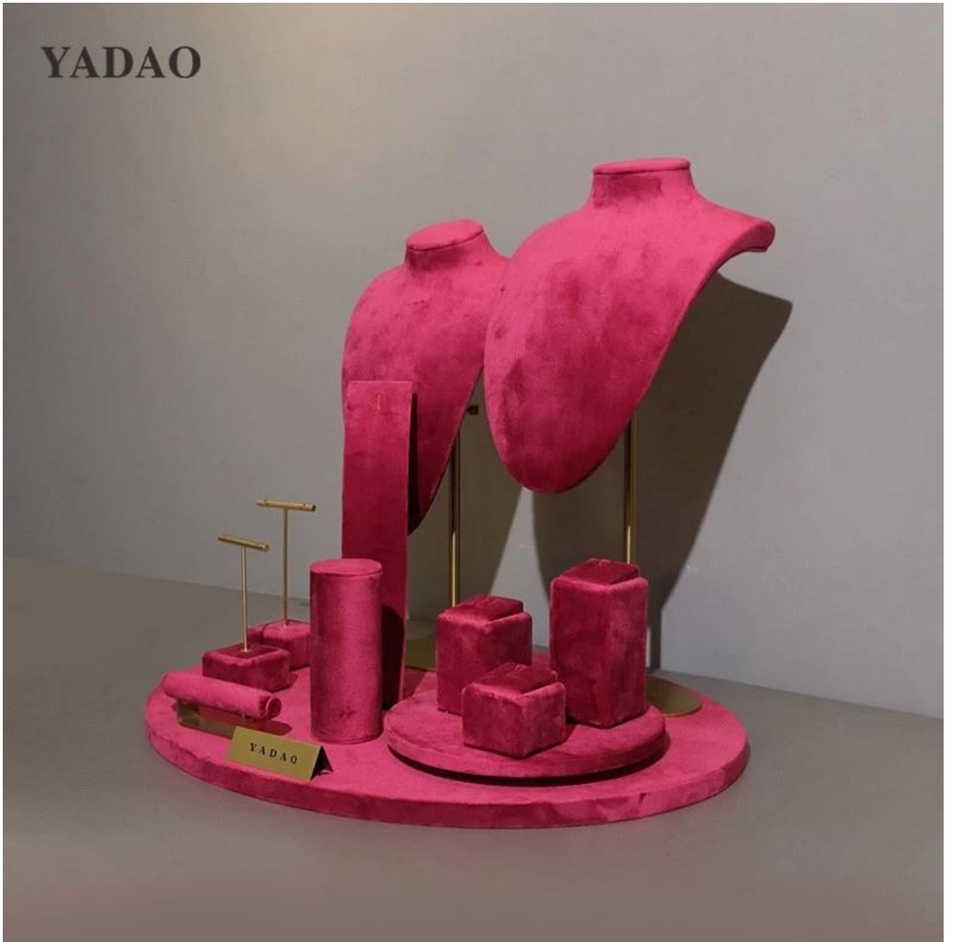
Escritório de Yadao