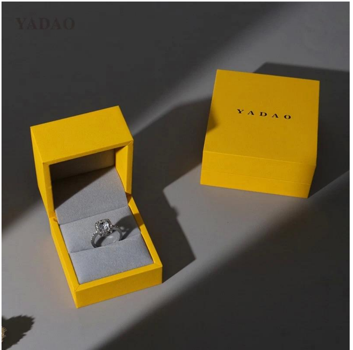
□L'ufficio di Yadao□