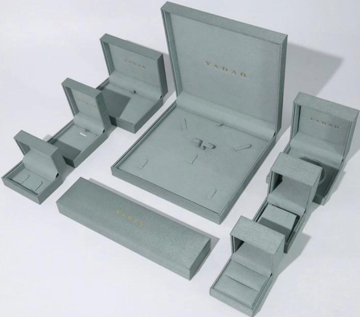
□Le bureau de Yadao□