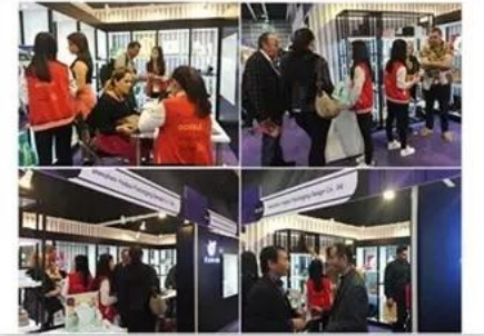
2018 Hongkong international jewellery show