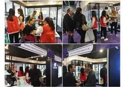
2018 Hongkong international jewellery show