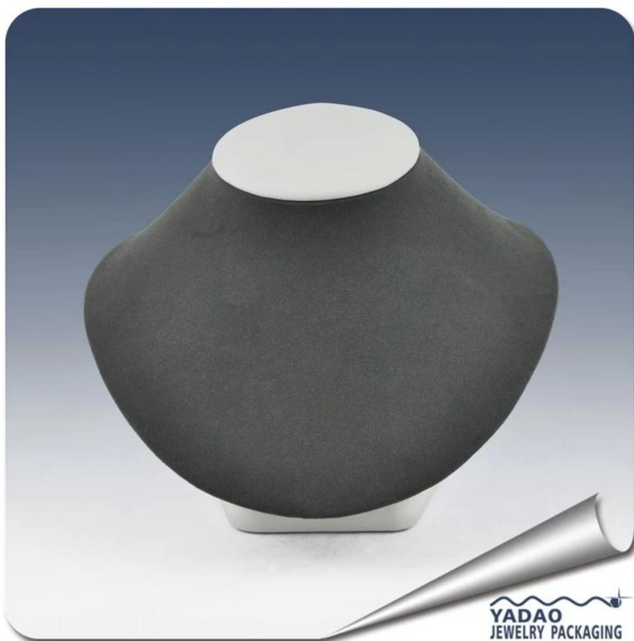
Imagen 3 del producto: